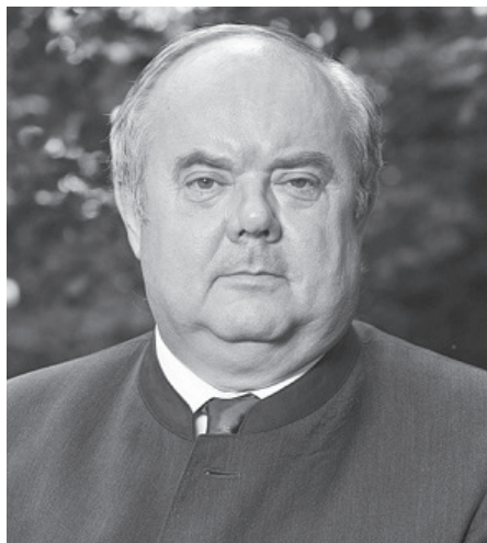
Zambó Péter államtitkár

Z.P.: A bérfejlesztés tekintetében az említett társaságról nem volt részletes adat, a bérfejlesztés vélhetően nem maradt el, de azt elképzelhetőnek tartom, hogy a tervezett bértömeg nem került kihasználásra. Valójában a 2020. évre elfogadott üzleti tervek teljesítése az év folyamán a pandémiás