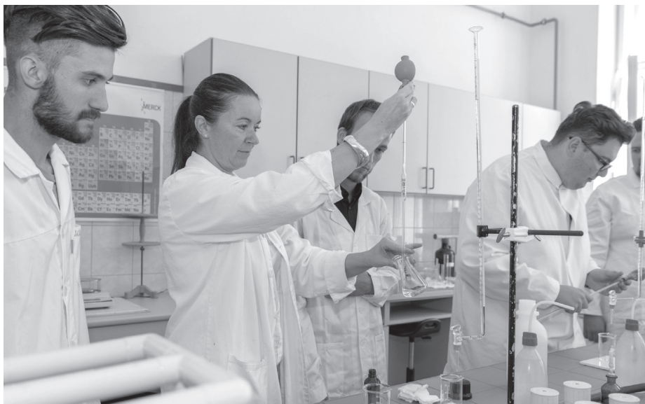
Munka a laborban

– Szeretnék felülemelkedni ezeken a szempontokon, és nem ezek alapján kértem fel a helyetteseimet sem. Selmecbányán is komplex egységben, egymásra utalva élt a bányászat, a kohászat és az erdészet. Ezek a szakmák kiegészítették egymást. Ma már az erdőmérnökképzés nem elegendő ahhoz, hogy egyetemenként működjünk. A komplexitás úgy néz ki, hogy az erdők kezelése során faanyag keletkezik, ott él a vad, a fát feldolgozzuk, megkötjük a légköri szén, a fából készülő házat és más termékeket a piacon eladjuk, és ezekben a házakban laknak a jövő generációi. Ebből a komplexitásból adódóan az egyetemünk olyan képzéseket nyújt, amelyhez hasonló más egyetem nem tud. A zöld egyetemen szeretnék túllépni, mert mi nem csak zöldek vagyunk, nemcsak a vízhasználatra, meg a szemétkézelésre figyelünk, hanem fenntarthatóak vagyunk, amiben a közösség is bennfoglaltatik. A legfontosabb feladatunk a saját identitásunk megteremtése az utóbbi évtized hanyatlásai után. A letisztult énkép megteremtése után nézhetünk körül újabb területek