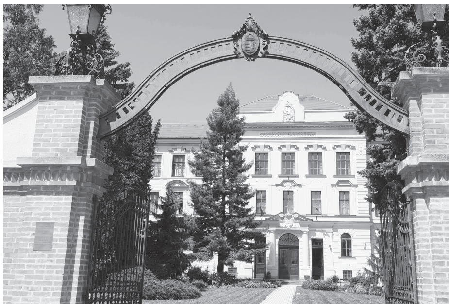
Az Alma Mater főépülete

– A színvonalas, 21. századi, nemzetközi szinten is elismert oktató-kutató munkához infrastrukturális fejlesztések