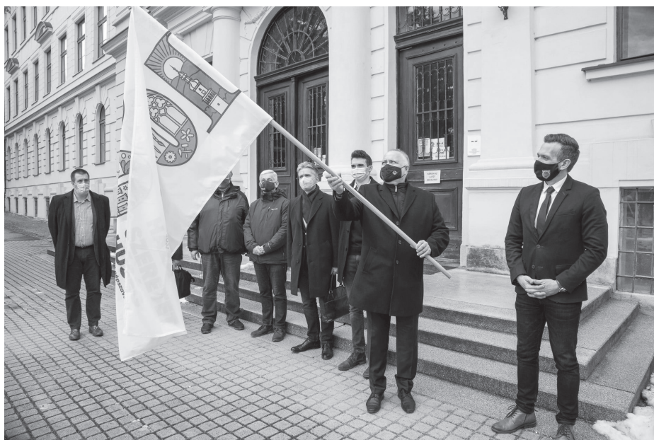
Emlékezés a centenáriumra

– Nem, az egy forma, mi a tartalmi elemekről beszélgetünk. Erdészeti tudásközpont kialakításán munkálkodunk a középfokú képzést végző agrárcentrumokkal és az erdőgazdálkodókkal közösen. Egy irányba mutató oktatási-kutatási gondolkodásra van szükségünk. A képzés egyik nagy gondja például, hogy az osztott (Bsc-Msc) képzés idején „elveszték” műszaki tárgyak, ezáltal szűkültek az elhelyezkedés lehetőségei. Napjainkban mintegy 30 óra a közvetlen, kontakt órák száma. Ez csökkenti a csoportmunka tapasztalati szerepét. A jövő a kötelező kontakt óraszám csökkentése, nagyobb szabadság a hallgatóknak az önállóság terén, és emellett olyan oldalági képzési lehetőségek biztosítása, amelyek elvégzése további szakmai előmenetelt biztosít. Ezzel a hallgató megkapja például az útépités alapjait, és ha visszajön újabb két félévre, akkor felteheti a koronát az erde-