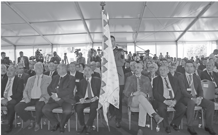
A bugaci sátorban

Programadó gondolatokat is megfogalmazott: „Az erdészet a klímaváltozás hatásainak mérsékléséért, erdeink