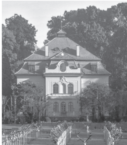
A Vadászmajor központi épülete: az úgynevezett Nagykastély.

Bács-Kiskun megye déli részén, szinte már csak kőhajtásnyira a magyar-szerb országhatártól, egy szép parkerdő által körülvevett 30 hektáros angolpark hatalmas fáin között is áll néhány szép régi épület, amelyek sorsának alakulása nagyjából a bevezetőben vázolt „magyar kastély életpálya-modell” mintázza. De azzal a nem elhanyagolható különbséggel, hogy ez a történet happy enddel végződött. (Legalább is eddig és reményeink szerint továbbra is.)