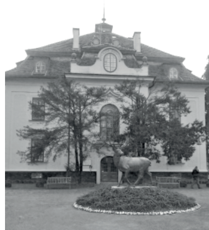
Gímszarvas szobor a Nagy-kastélynál

A szép külső mögött gondosan, szakszerűen kiépített közművesítési-épületgépészeti belső biztosítja az épületek magas színvonalon történő üze-