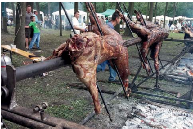
Szabadtűzőn készül a nyárson sült vadpecsenye.