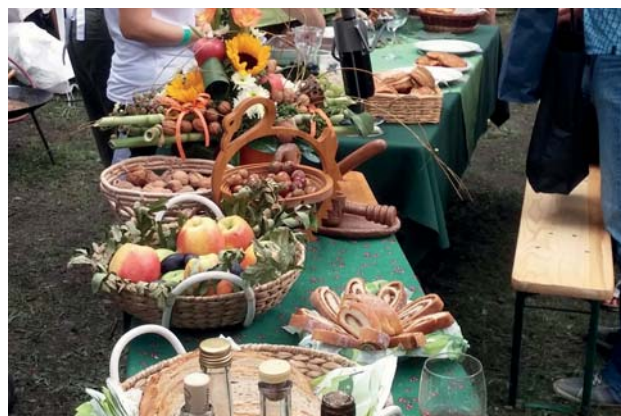
A terített asztalokon volt minden, mi szem s szájnak ingere.