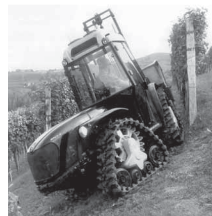
Az Antonio Carraro olasz gépgyár „Mach 4” tip. kistraktora zárt, klimatizált vezetőfülkével szerelve, szőlőmunkában tolómenetben. A képen jól szemügyre vehető a speciális gumihernyótalpas futómű a meghajtókerékkel és a feszítő-futógörgőkkel.

Az idei kiállítás örömteli eseménye volt, hogy az „AGROMash- EXPO,