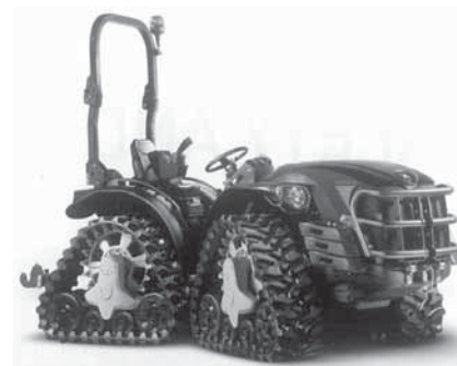
A „Mach 4” hernyótalp-futóműves traktor vezetőfülke nélküli változata, védőkerettel szerelve. Vontatmány nélkül a gép önsúlyának 60%-a nehezedik az első futóműre.

Az elsősorban szőlőművelésre tervezett olasz kistraktorok (pl. Goldoni) közül némelyeket ajánlottak erdészeti célokra is. Gondoljuk, leginkább a „két-éltű” gazdák számára; vagyis azoknak, akik mezőgazdasági földjeik mellett kisebb erdőbirtokkal is rendelkeznek.